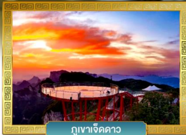
กูเวาเจ็ดดาว