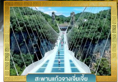
สะพานแก้วจางเจียเจีย