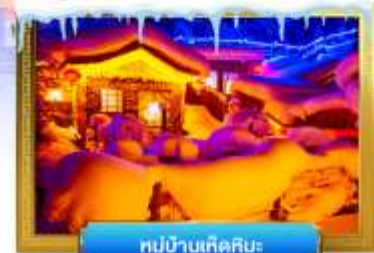
หมู่บ้านเกิดหิมะ

เดินทางโดย : สายการบินโซน่าเซาเทิร์นแอร์ไลน์