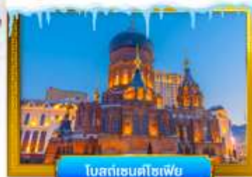
โลกแดนตึชเพีย