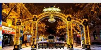
ถนนคนเดินจงหยาง