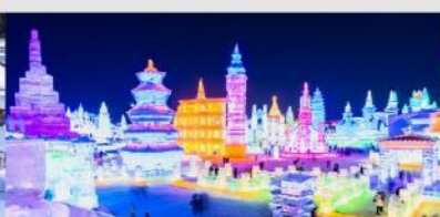
เทศกาลโคมไฟน้ำแข็ง