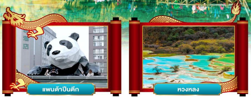
แพนด้าปิ่นดิก