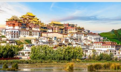
วัดลามะชงจันหลิน