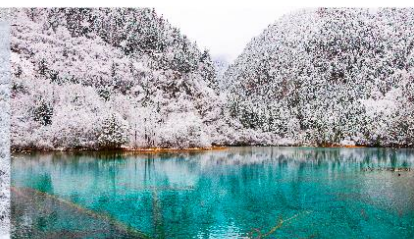
อุทยานแห่งชาติจิวฉ่ายโกว