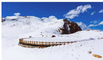
อุทยานต้ากู่ปิงชวน