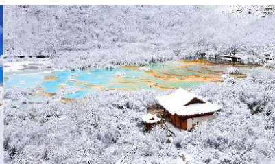
อุทยานแห่งชาติหวงหลง