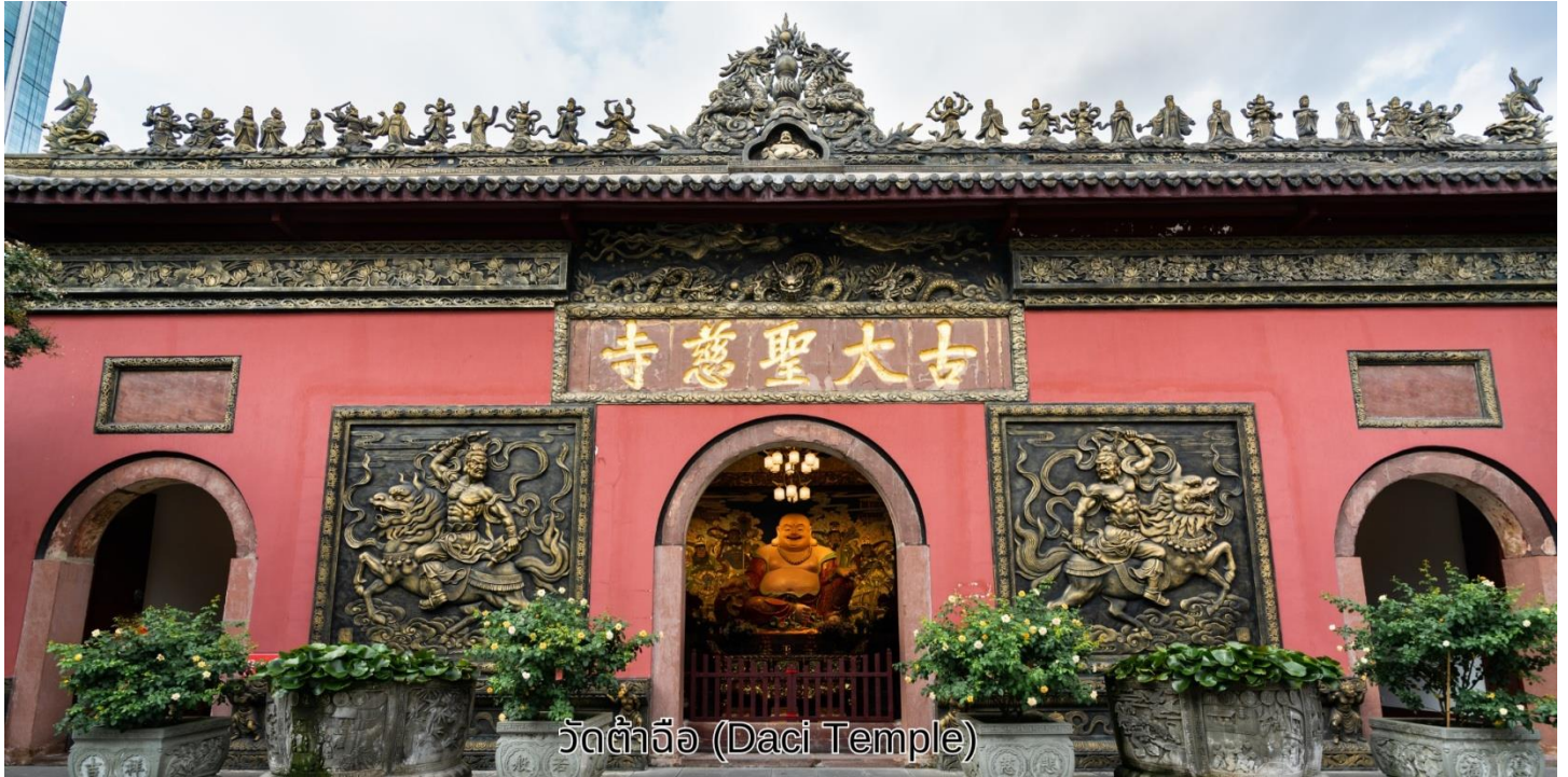
วัดต้าฉือ (Daci Temple)

จากนั้นเดินทางไปยัง วัดต้าฉือ เป็นวัดเก่าแก่ที่มีอายุยาวนานกว่า 1,600 ปี ตั้งอยู่ใจกลางของ Chengdu ที่นี่ถือเป็นสถานที่สำคัญที่น่าสนใจ เพราะเป็นวัดที่พระถังซำจั๋งบวชเป็นพระภิกษุก่อนจะย้ายไปจำพรรษายังวัดอื่นภายในวัดต้าฉือนั้นเงียบสงบ