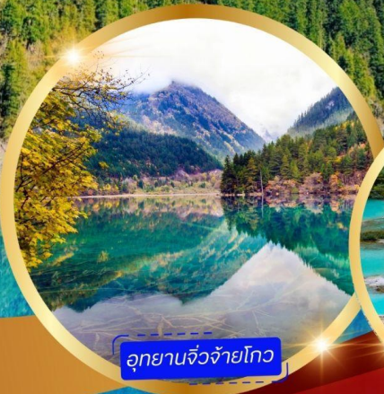
อุทยานจิวจี้โกว