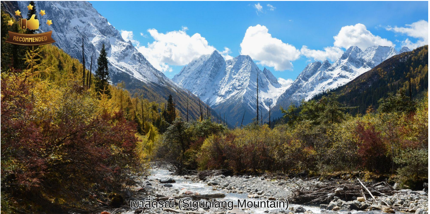
เขาสีดรุณี (Siguniang Mountain)