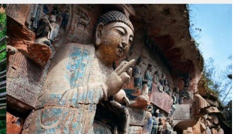
ผาหินแกะสลักต้าจู้ เขาเป่าติงซาน