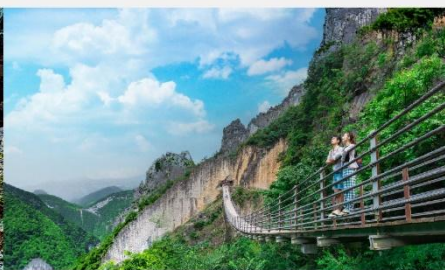
หุบเขารอยแยกอุ๋หลิงซาน