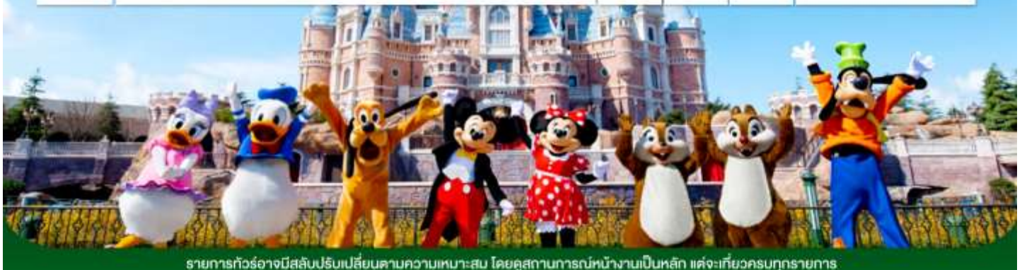
รายการทัวร์อาจมีสลับปรับเปลี่ยนตามความเหมาะสม โดยคู่สถานการณหน้างานเป็นหลัก แต่จะเที่ยวครบทุกรายการ