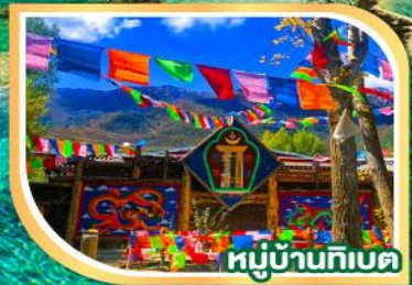
หมู่บ้านทิเบต