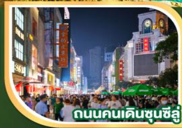
ถนนคนเดินชุนชี่