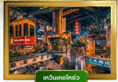
เหวินเหอไห่ยว