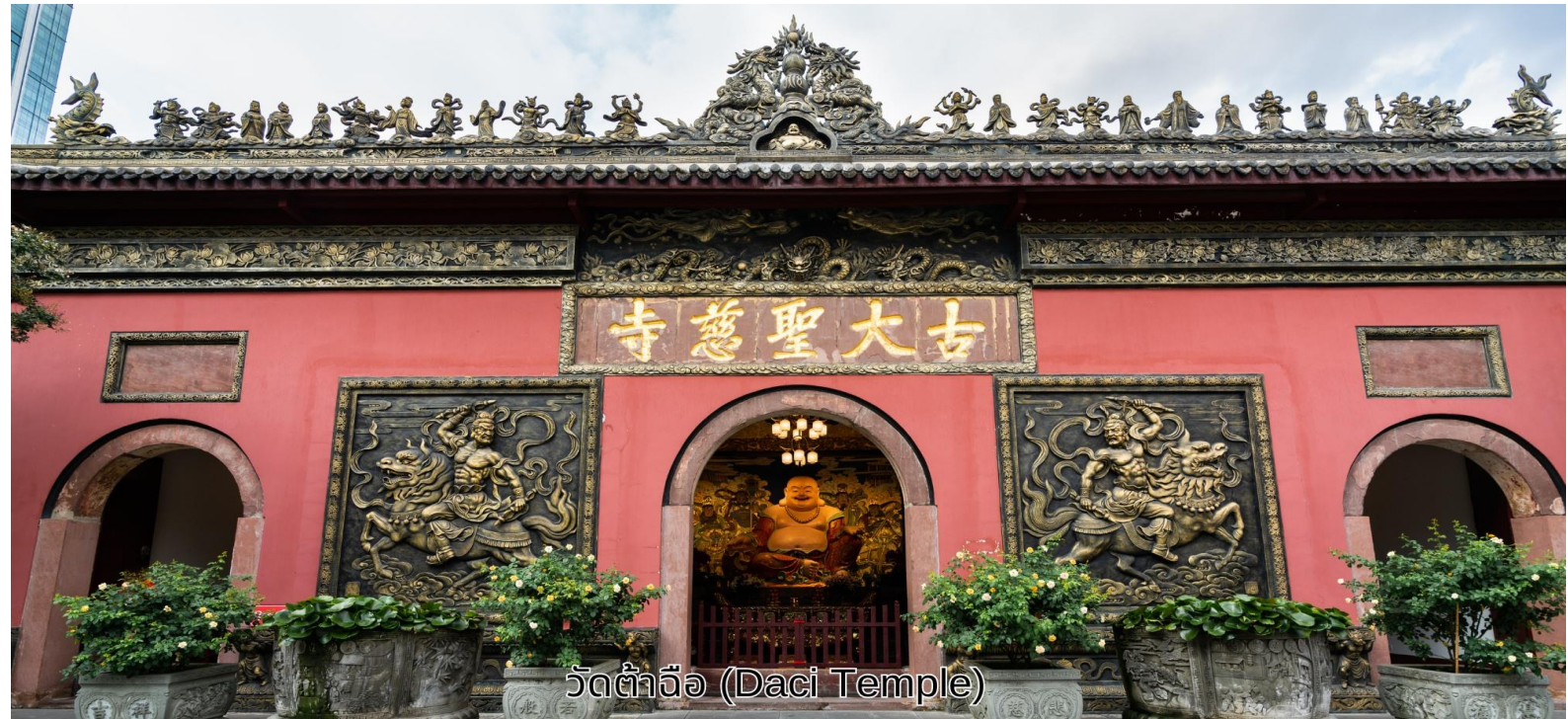
วัดต้าจื่อ (Daci Temple)

บ่าย จากนั้นเดินทางไปยัง วัดต้าจื่อ เป็นวัดเก่าแก่ที่มีอายุยาวนานกว่า 1,600ปีตั้งอยู่ใจกลางของChengdu ที่นี้ถือเป็นสถานที่สำคัญที่น่าสนใจเพราะเป็นวัดที่พระถังซำจั๋งบวชเป็นพระภิกษุก่อนจะย้ายไปจำพรรษายังวัดอื่นภายใน วัดต้าสิอั้นเจียบสงบ จากนั้นนำท่านสู่ ถนนคนเดินชุนซีลู่