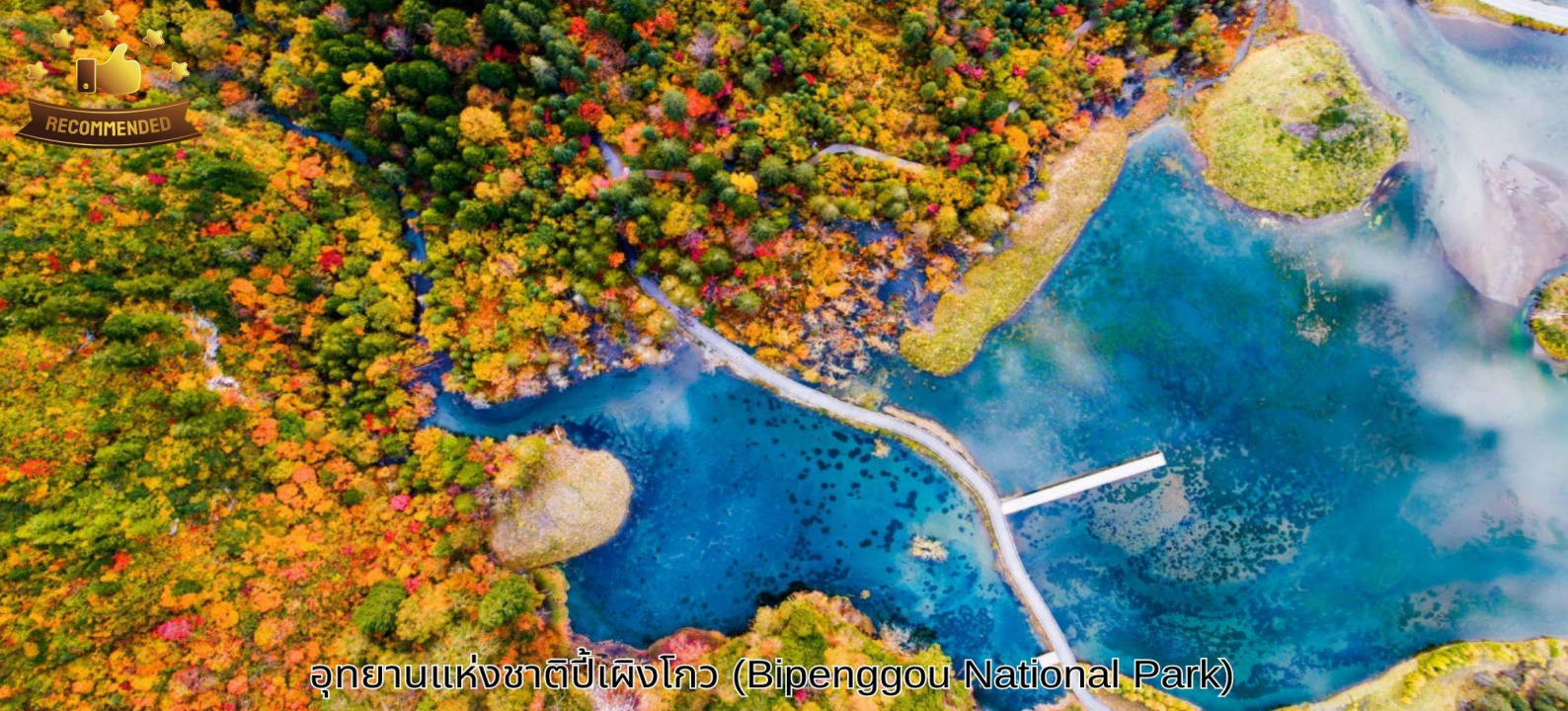
อุทยานแห่งชาติปีเผิงโกว (Bipenggou National Park)

คำ ที่พัก บริการอาหารค่ำ ณ ภัตตาคาร WEST QIANG HOMELAND HOTEL ระดับ 4* หรือเทียบเท่า