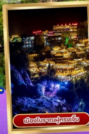
เมืองโบราณฝูหลงเจิน