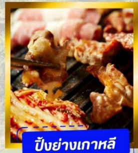
ปิ้งย่างเกาหลี