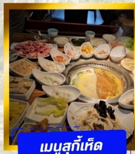
เมนูสุกั้เกิด