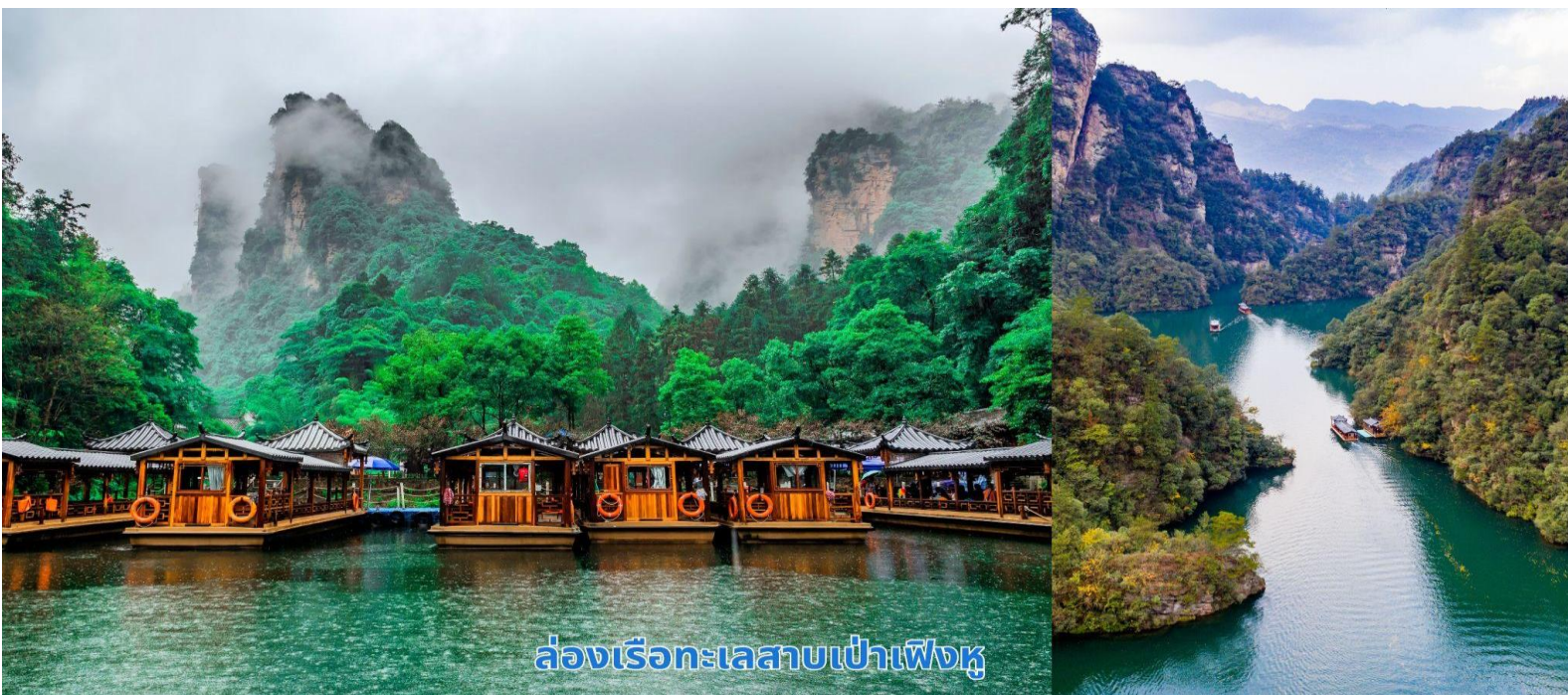
ล่องเรือทะเลสาบเป่าเฟิงหู

นำท่านเพลิดเพลินไปกับการล่องเรือชมความงามทะเลสาบเป่าเฟิงหู (Baofeng Lake) ทะเลสาบที่สวยงามด้วยน้ำที่เป็นสีเขียวเข้มราวกับเนื้อหยกโอบล้อมด้วยภูเขาหินรูปทรงประหลาดแปลกตาต่าง ๆ มากมายเป็นทะเลสาบบนที่สูง ที่หาชมได้ยาก ได้รับการขึ้นทะเบียนเป็นมรดกโลกทางธรรมชาติ ในปี ค.ศ. 1992