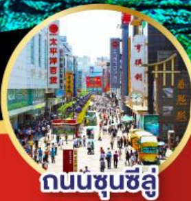
ถนนชุนซีลู่

ห้องพัก 4 ดาว ไม่เข้าร้านช้อปปิ้ง!! -เมนูพิเศษ สุกีหมาล่าเสว่น , เปิดบักกิ้ง