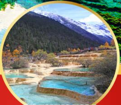
อุทยานหลวงหลง