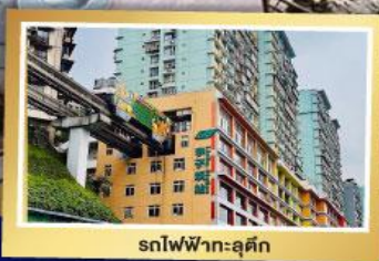
รถไฟฟ้า-สุตึก