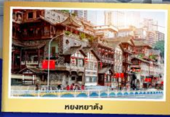
หยงหยาดัง