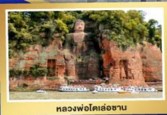
หลวงฟ่งโตเล่อซาน

ฟรี ประกัน สุขภาพ และอุบัติเหตุ และอุบัติเหตุ GTIP Plus (Gold Plan) 3 คุ้มครองสูงสุด ล้านบาท *เงื่อนไขขึ้นอยู่กับบริษัทฯ ความคุ้มครองเป็นไปตามกรมธรรม์ประกันภัย