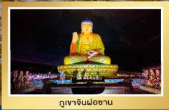
ภูเขาจินฝอซาน