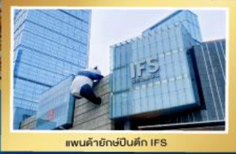
แพนด้ายักษ์ปิ่นตึก IFS