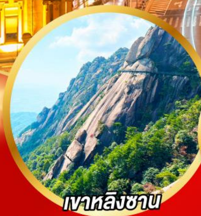
เวาหลิงซาน