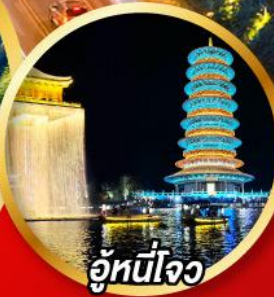
อู่หนี่โจว