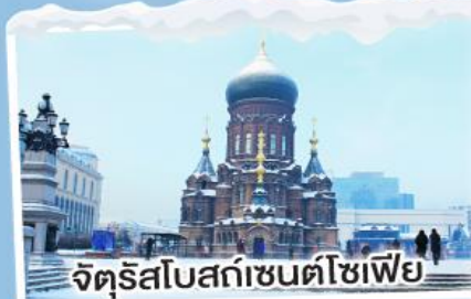
จัตุรัสโบสถ์เซ็นต์โซเฟีย