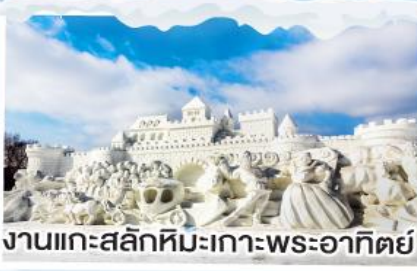
งานแกะสลักหิมะเกาะพระอาทิตย์