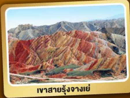
เวาสายรุ้งจางเย่