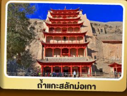
ถ้ำแกะสลักม่อเกา