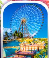
เมืองแฟนตาซี