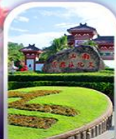
อุทยานหนานซาน

ทางเดินริมชายทะเลซานย่า - ทุ่งดอกกุหลาบอ่าวย่าหลง อุทยานหนานซาน - เที่ยวบนเกาะดอกไม้ - ทุ่งเกลือพันปี ช้อปปิ้งในมาร์เก็ตถนนโบราณฉีหลว