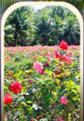
ทุ่งอ่าวย่าหลง

God like ไพล่า 7777 สะท้อนสะท้อนทั่วเกาะ สาวกห้ามพลาด ตามล่าป๊อปปูล่าสุดคิ้วท์!!!