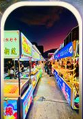
ตลาดอ๊ะเหิง