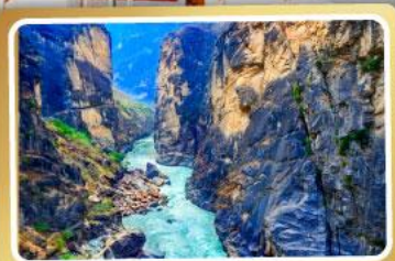
ช่องแคบเสียนโงะโจน