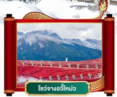
โชว์จางอวี๋โหม่ว