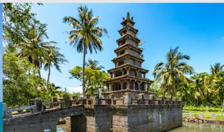
เจดีย์ 2 ชั้นนั่งเหม่ยหลาง