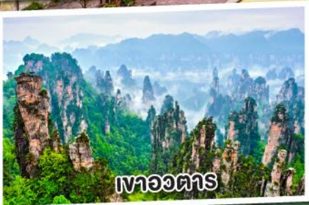
เหวอวตาร