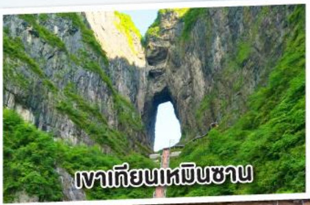
เทวเทียนเหมินซาน

ฉางเจียเจีย เทียนเหมินซาน เหวอวตาร สะพานแก้ว เมืองโบราณฝูหลง เฟื่องหวง 5 วัน 4 คืน