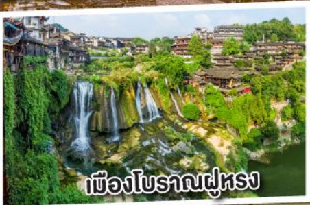
เมืองโบราณฝูหลง