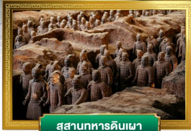
สุสานทหารดินเผา