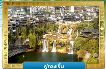
ฟูหยางเจี๋ย