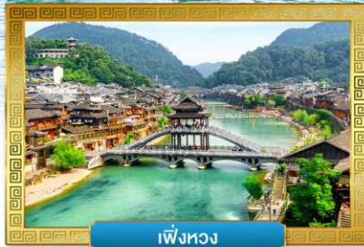
เฟิ่งหวง