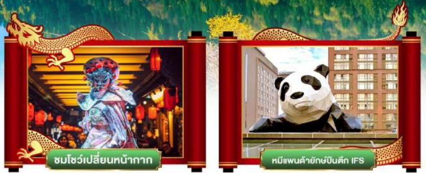
ชมโชว์เปลี่ยนหน้ากาก

• ชมโชว์เปลี่ยนหน้ากาก ความลับแห่งเฉินตู