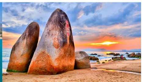
วนอุทยานสุดขอบฟ้า