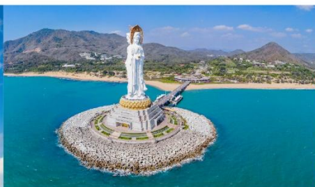
เจ้าแม่กวนอิมหนานชาน