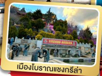
เมืองโบราณแซงกรี่ล่า