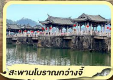
• สะพานโบราณกว่างจี