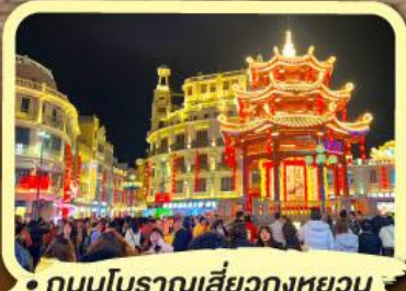
• ถนนโบราณเสี่ยวกงหยวน