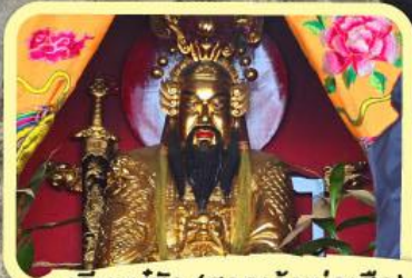
• เอียงบูซิว (ศาลเจ้าพ่อเสือ)