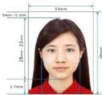
Paper Photo for Visa Application Form