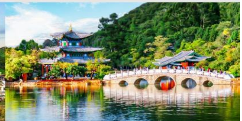
สระมังกรดำ