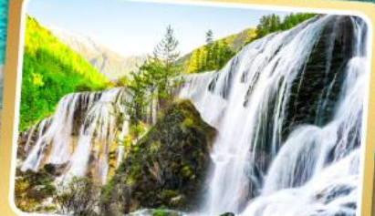
น้ำตกธารไข่มุก