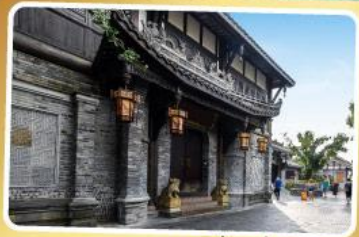
ถนนควานโจ๋เซียงจื่อ