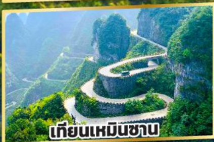
เทียนเหมินชาน