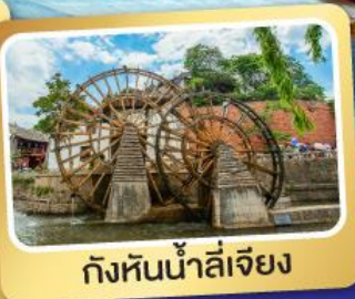
กังหันน้ำลี่เจียง