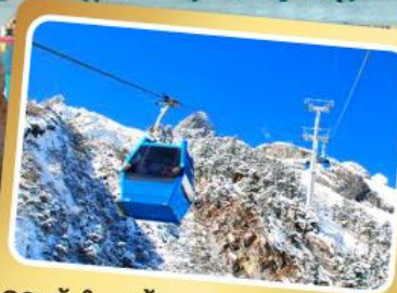
กระเช้าใหญ่ขึ้นภูเขาหิมะมังกรหยก