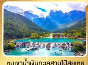
หุบเขาน้ำเงินทะเลสาบไป๋สุยเหอ