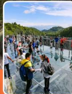
ระเบียงแก้วอุ๋หลง

ภูเขาหว่าอูซาน (รวมขึ้นกระเช้าไป-กลับ)- อุทยานเขานางฟ้า อุทยานหลุมฟ้าสะพานสวรรค์ - ระเบียงแก้วอุ๋หลง - รถไฟฟ้ากะลุดติก หงหยาดัง - วัดเป้ากั๋ว - หลวงพ่อโตเล่อซาน - วัดต้าฉือ หมี่แพนตั๋ยักษ์ ซ้อปั้ง ถนนคนเดินซุนซึลู่ ไท่กู่หลี่