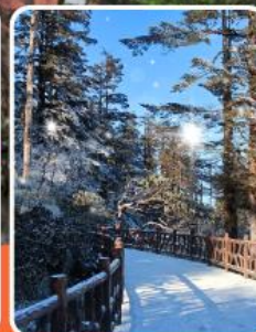
ภูเขาหว่าอูซาน