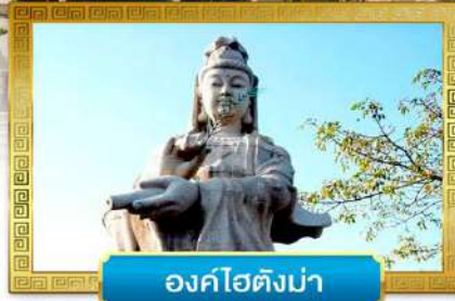
องค์ไชตังม่า