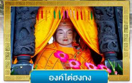
องค์ไต๋องกง