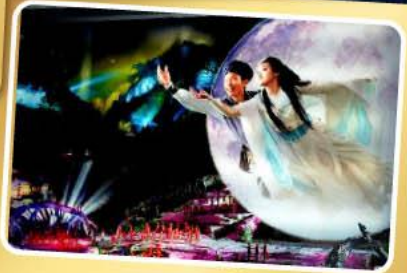
โชว์จิ้งจอกขาว