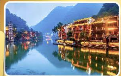
เมืองโบราณฟิ่งหวง