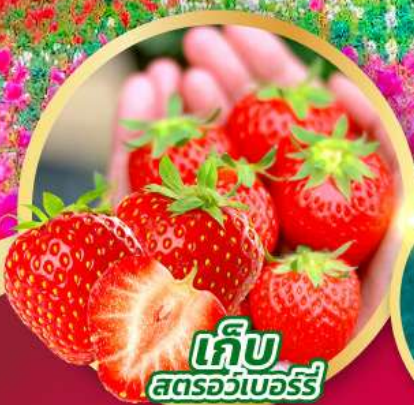
เก็บ สตอร์วเบอร์รี่