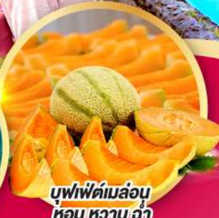
บุฟเฟ่ต์เมล่อน หอม หวาน ฉ่ำ