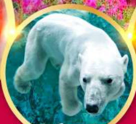
สวนสัตว์อาซาฮิยามะ