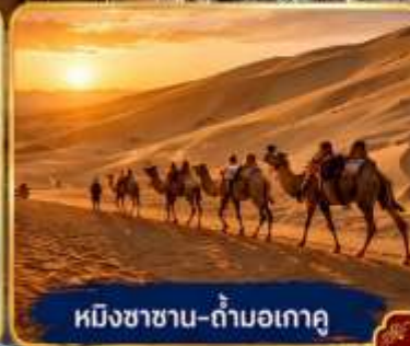
หมิงซาฮาน-กำแพงเกาตุ