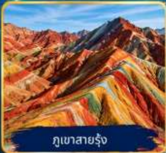
ภูเขาสายรุ้ง