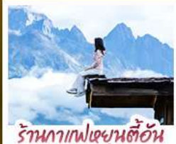
ร้านอาหารฟิชเชียนตี้ฮัน

ชมวิวภูเขาหิมะสวยสุดโรแมนติกกับแสงยามพลบค่ำ เที่ยวเมืองโบราณต้าหลี่ ลี้เจียง ป่าชา แซงกรล่า ชมวิถีชีวิตของชุมชนยูนนานและกิบต พิสูจน์ความกล้าท้าเดินชมสะพานแกว่งลี้เจียง • ซุปปิ้งเพลินที่ถนนคนเดินหนานผิงเจียง