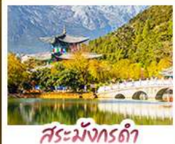
สระมั่งกรดำ