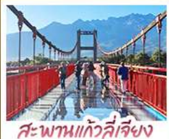
สะพานแกว่งลี้เจียง