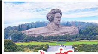
เกาะส้มจู้จี้โจว