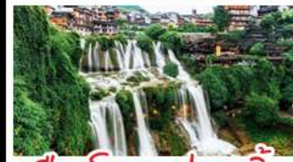
เมืองโบราณฟูหลงจิ้น