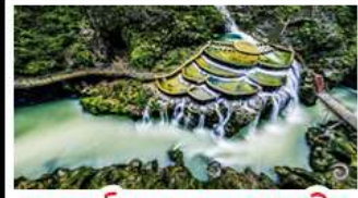
แกรนด์แคนยอนหลงเหอ

เขาฟ่านจิ้ง - เมืองโบราณฟูหลงจิ้น เมืองโบราณเฟิงหวง - เกาะส้มจู้จี้โจว แกรนด์แคนยอนหลงเหอ - ไม่เข้าร้านช้อปปิ้ง พักโรงแรม 5 ดาว - รถไฟความเร็วสูง