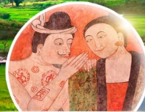
ปูม่านย่าม่าน