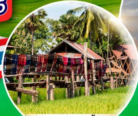
กาแฟบ้านไถลื้อ