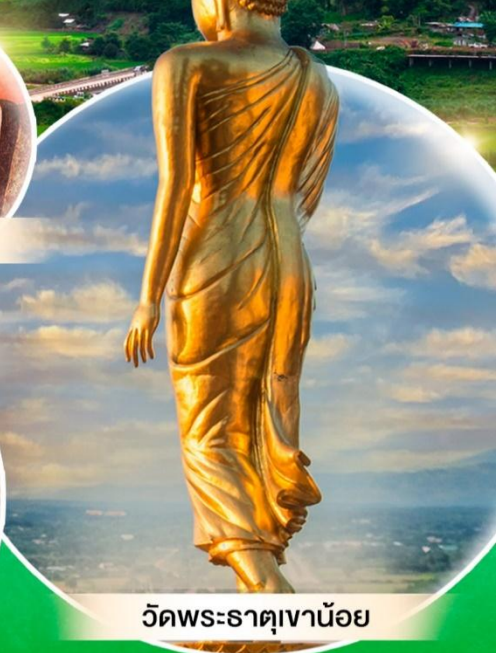
วัดพระธาตุเขาน้อย